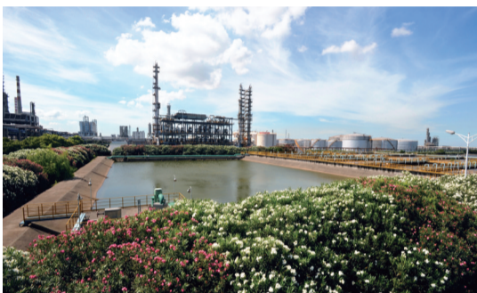
镇海炼化污水处理场