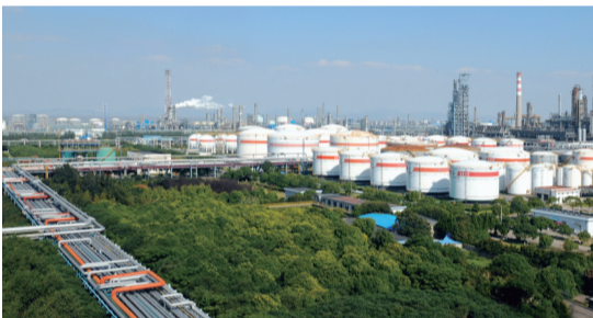
镇海炼化绿色管廊