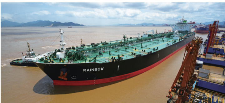
镇海炼化算山码头