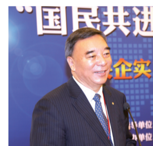
中国建材集团董事长宋志平

“国民共进”是指国企和民企要共同发展,要发展混合所有制。“央地共赢”是指中央企业要和地方政府合作,实现互利共赢。这正是我们经济生活中一个重要的主题,即包容性、融合性发展。