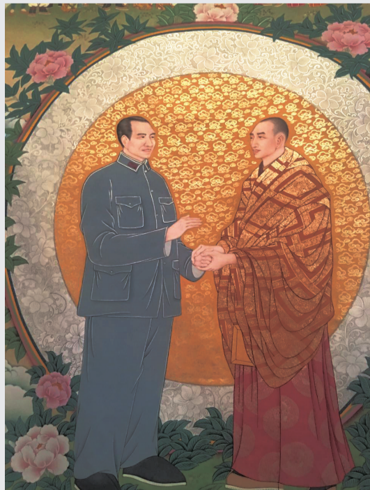
唐卡·《朱总司令与格达活佛(局部)》