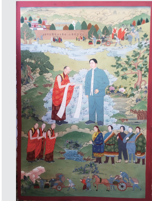
唐卡·《毛主席参观永寿寺》

据悉,此次长征系列唐卡的展出,还将在遵义、会宁、康定、马尔康等红军走过的英雄城继续传递下去,红色文化将世代延续。