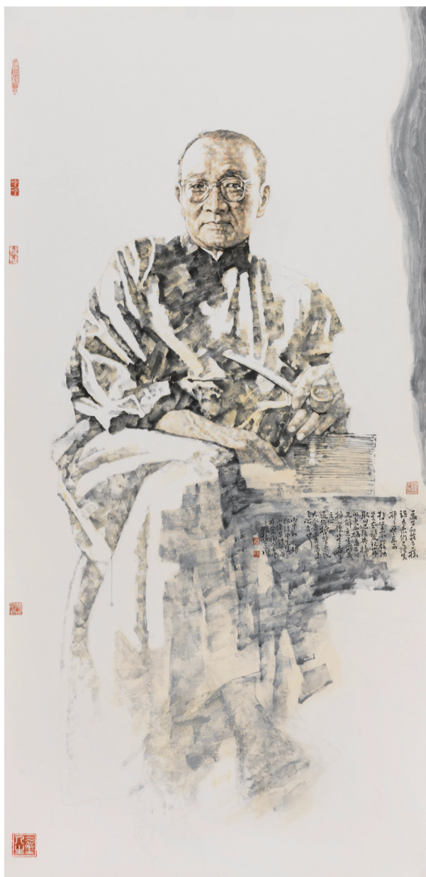
《先贤录——林语堂》260cm x 126cm 2016年