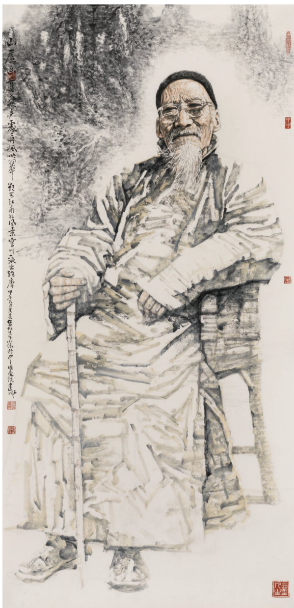
《先贤录——黄宾虹》260cm x 126cm 2014年