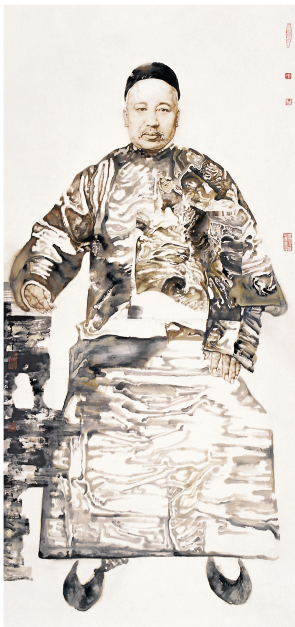
《先贤录——康有为》260cm x 126cm 2007年