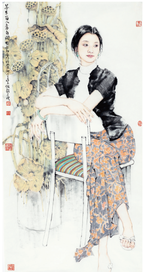
《芳草留人宜自闲》137cm x 68cm 2014年