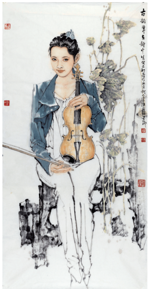
《古韵常在静中生》137cm x 68cm 2013年