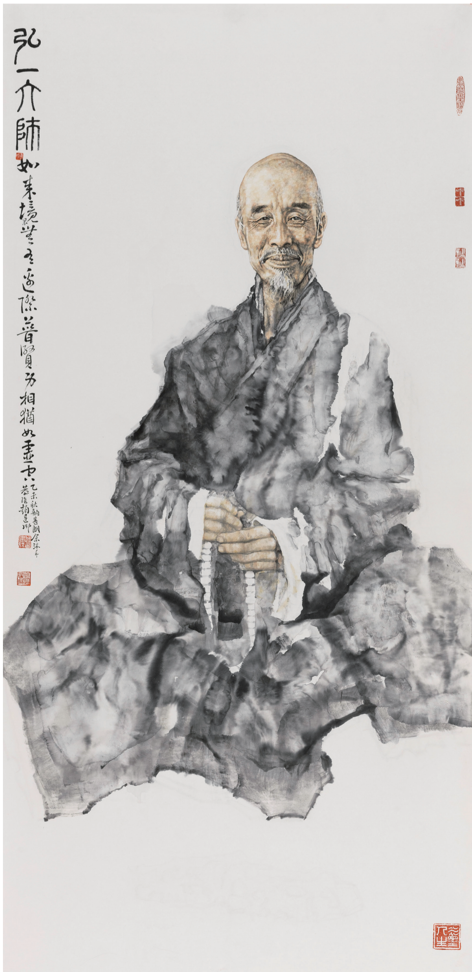
《先贤录——弘一法师》260cm x 126cm 2016年