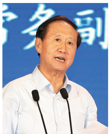
中国企联常务副会长兼理事长李德成主持大会

十届全国政协常务副主席、中国企业联合会、中国企业家协会会长王忠禹,广西壮族自治区党委书记彭清华,广西壮族自治区主席陈武,国务院国资委副主任刘强,工业和信息化部副部长辛国斌,广西壮族自治区党委常委、秘书长范晓莉,广西壮族自治区党委常委、自治区副主席蓝天立,广西壮族自治区党委常委、南宁市委书记王小东,广西壮族自治区副主席陈刚,广西壮族自治区政府秘书长莫恭明,韩国新万金开发厅厅长李秉国,中国企联驻会副会