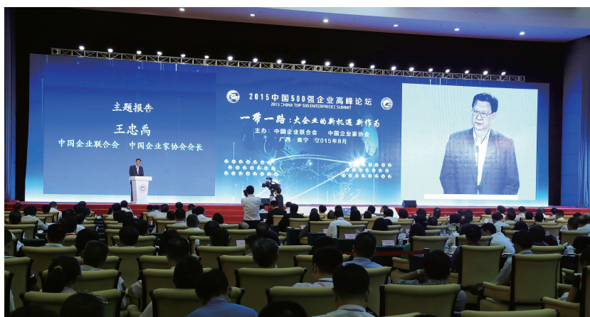
2015中国500强企业高峰论坛会场

王忠禹作主旨发言时指出,下一步中国大企业要着力通过重组整合,继续扩大规模和市场占有率实现做大;通过不断创新,提升在核心技术、标准制定、