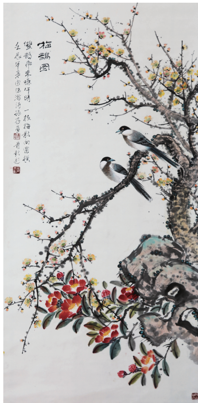
《梅鹊图》花鸟画 138cm x 69cm