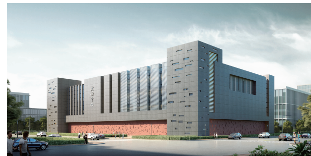
宿州高新区世纪互联智慧云计算产业园数据中心

据介绍，随着高新区云计算产业园被纳入安徽省云计算产业发展规划，高新区成为省级信息消费试点县区、省级电子商务产业园等全方位的大力支持，宿州将率先抢占全国云计算产业发展战略高地，实现云计算产业发展“三级跳”，即2017年实现产值300亿元，2020年实现产值800亿元，“十四五”初期建成在全国有重要地位的千亿级云计算特色基地。