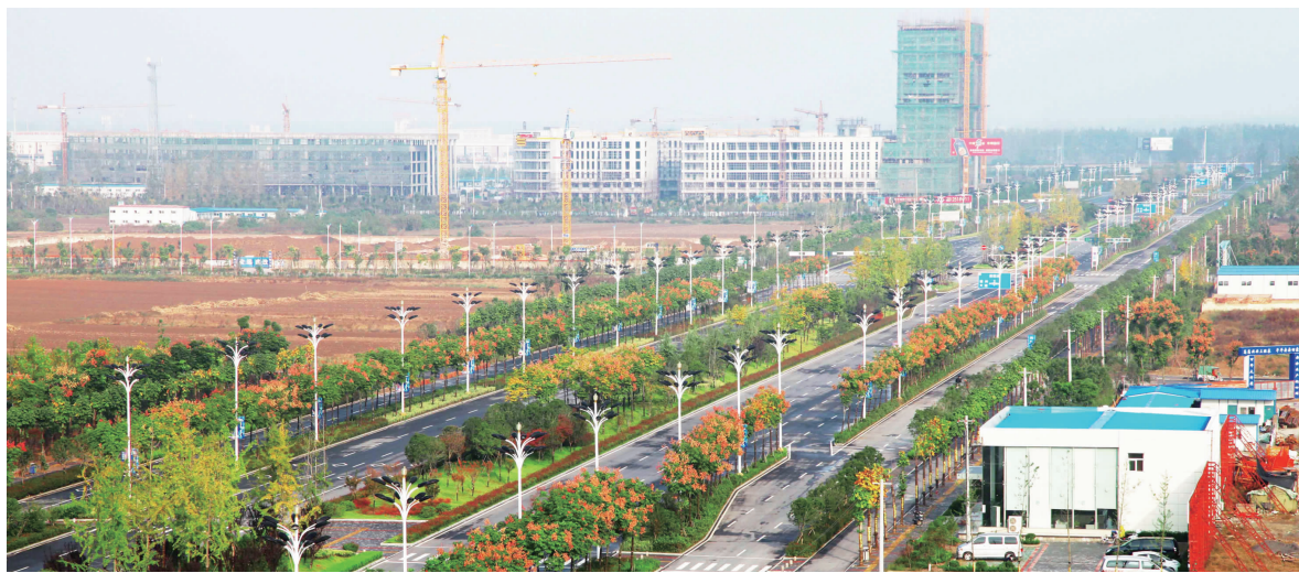
宿马现代产业园区新城

同时，宿马园区还积极坚持“走出去”学习，组织机关各有关部门、宿马投资公司、托管乡镇相关负责人先后到芜湖江北产业集聚区、郑浦高新区、马鞍山慈湖高新技术产业园区、