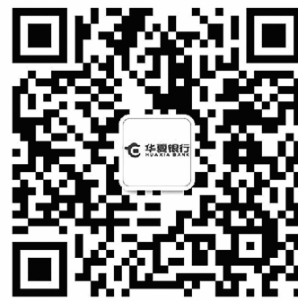
扫一扫,更多精彩等着你

华夏银行为解决贷款使用周期短;转贷成本高;审批速度慢等问题,特推出年审制贷款产品