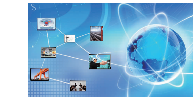
华商平台“四流”归一

由山东华兴机械股份有限公司发起,与山东省新兴物产有限公司共同筹建的山东华商金属板材交易中心,获得山东省金融工作办公室批复同意筹建。