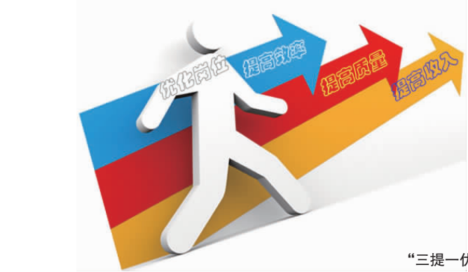
“三提一优”内外交赞

为表彰和推广优秀管理经验,山东省企业管理奖设置了企业和管理创新成果两大奖项,这是山东省政府在企业领域设立的最高奖项。华兴公司荣登榜单,充分体现了山东省政府及社会各界对公司长期以来加强科技创新、践行现代化管理的肯定与支持。