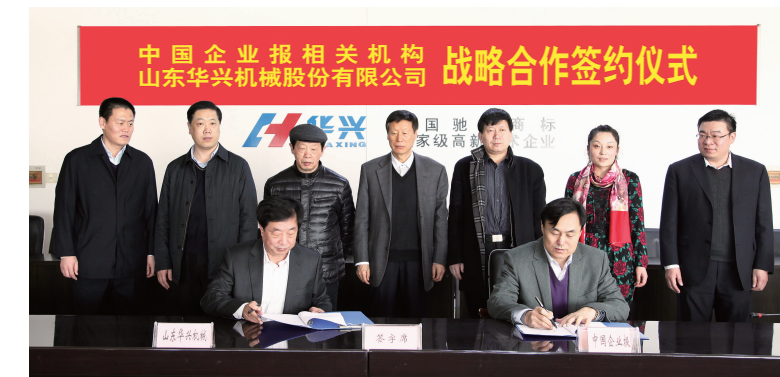
媒企合作 携手共赢

为进一步探索十八届三中全会提出的“积极发展混合所有制经济”的要求,实现产权主体多元化,完善现代企业制度,华兴公司同《中国企