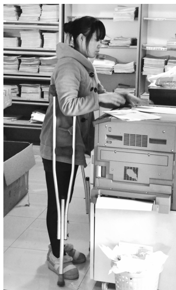
安邦制药残疾员工在快乐工作

安邦制药公司用三个百分百保证残疾员工同工同酬 用企业大爱激发残疾员工爱生活、爱工作