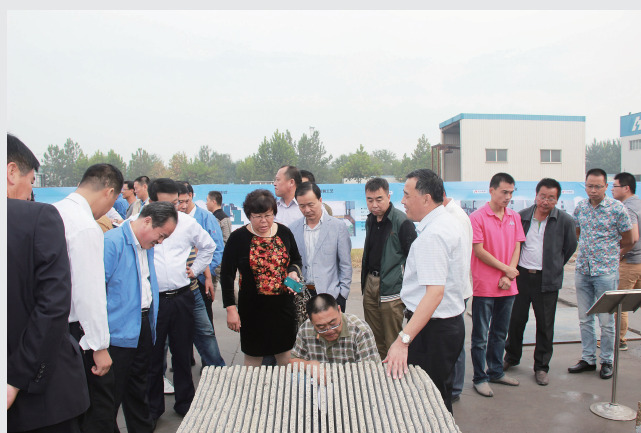
条缕清晰无可挑剔