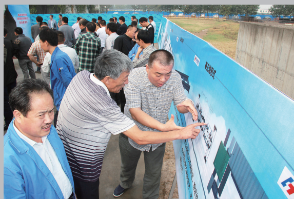
因为科学所以高效