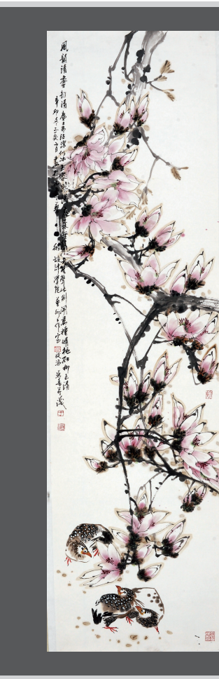
《春》180 x 49cm

于源春先生生于齐鲁之邦，深受齐鲁文化的滋养，谦恭好学，勇于探索。虽然工作繁忙，但他从不放弃对艺术本真的孜孜追求，几十年如一日，潜心作画，广收博取，注重画外功的培养和修炼，对古代名家名作做了大量的阅读和学习，对中国花鸟画作了深入、细致的探索研究；工笔花鸟艺术的用色、造型、构图，山水画的格调、写意画的笔墨运用等等，在师法传统艺术的基础上，不推崇刻意创新，但求在书画艺术上精益求精、画随时代。他的作品往往以朴实的绘画语言勾勒出物象的精灵、神韵，塑造出清新柔美的意境，显示出创作者深厚的文化底蕴。