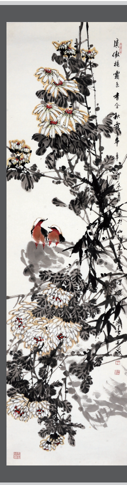
《秋》180 x 49cm