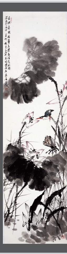
《画》180 x 49cm