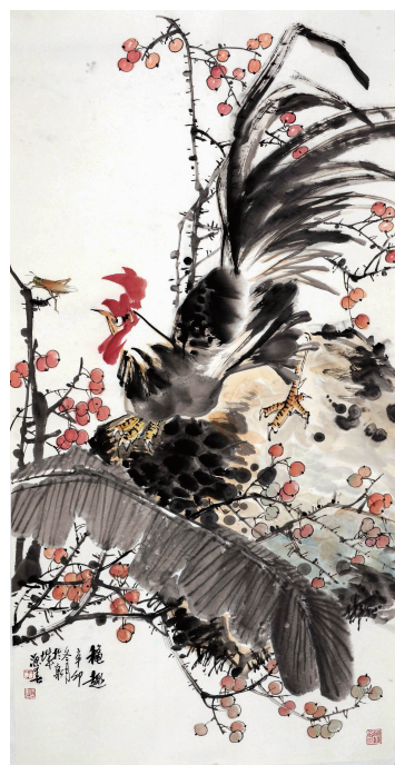
《秋趣》138 x 69cm