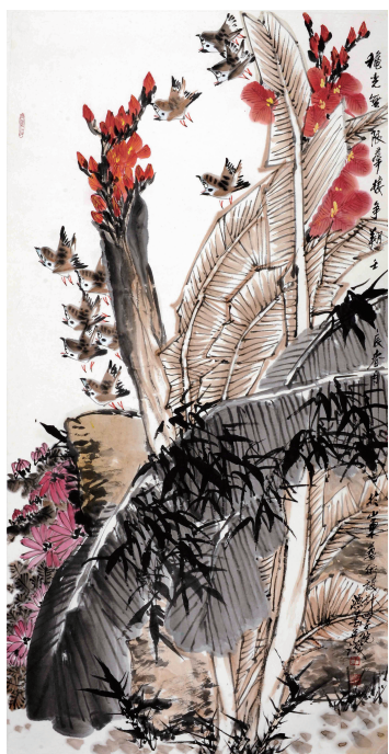
《秋花》138 x 69cm

观于源春先生的作品，能真切地感受到他笔为心声，以物言情，以物言志、弘扬人文的精神，他的作品不机械模仿、临摹，而是以饱满情感的笔墨来描绘花、鸟世界的精彩。