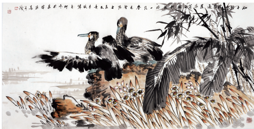
《路路通》138 x 69cm

1983、1998、2005、2007年分别在马来西亚、北京、徐州、聊城等地以及中央电视台、中央党校、山东省博物馆等单位举办个人画展，当代中国画家十人联展，当代中青年实力派中国画家作品邀请展等，原全国人大副委员长吴阶平曾为其画展剪彩。参加了山东、天津、北京等地的中国书画保真拍卖会，创造了拍卖会拍卖较高纪录。多次赴欧洲八国、东南亚各国、朝鲜、俄罗斯等地举办画展和进行学术交流。出版《于源春画集》《于源春画选》《四季骏马图》《高校优秀学员画集》台历、挂历等。在国家、省级报刊、杂志发表多篇美术论文及国画作品。作品被全国工商联、国家领导人、省、地、市领导以礼品赠送国际友人和国外社团，被中央党校、军事博物馆、张大千、王羲之、李苦禅、王雪涛、张衡、张仲景等纪念馆、博物馆、艺术团体等收藏。