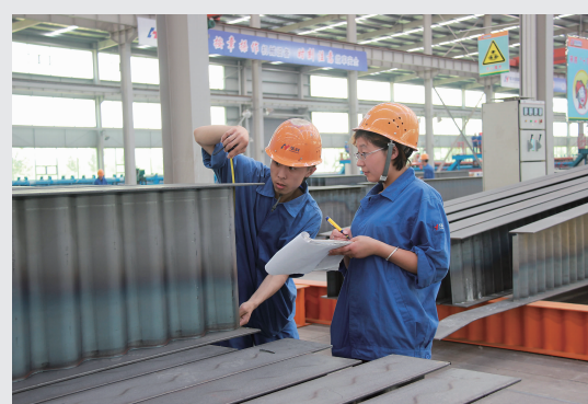
严丝合缝——波腹板构件检验不含糊