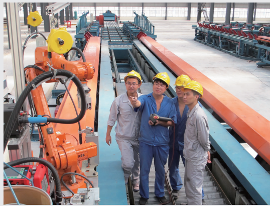
服务跟进——为售出的波腹板生产线提供上门服务