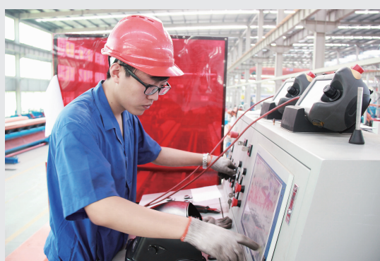
独当一面——长约八十米的生产线主操只要一人担当