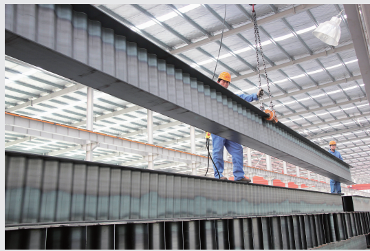
横空出世——波腹板订单已排到十月份