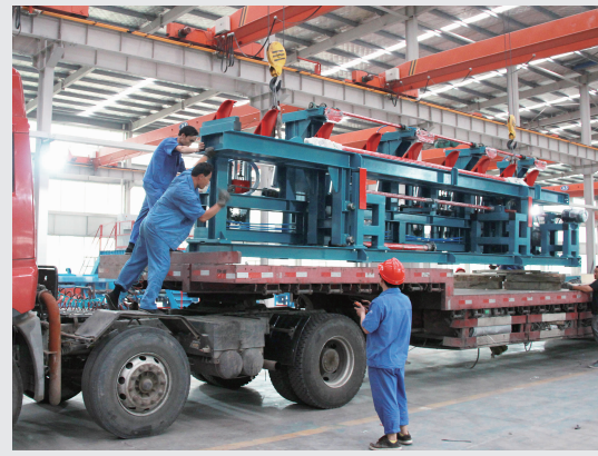
整装待发——又一波腹板生产线发货起运