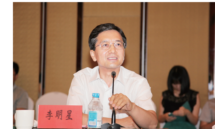
中国企业联合会驻会副会长李明星

此外,李明星还透露,2014年的500强发布会将于9月2日在重庆召开。目前,重庆市一位常务副市长已经亲自带队,和企联方面探讨怎么更好落实国家两江新区战略发展问