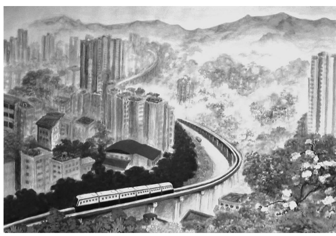
急流峻岭好修身 畅通山城春更美