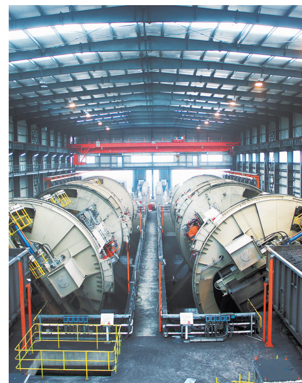
黄骅港三期、四期工程翻车机,国内外港口首次采用的可卸多种车型的四翻式O型端环翻车机,额定能力每小时8000吨,为世界之最。

海阔凭鱼跃,天高任鸟飞。一航安人将心系梦想,厚积薄发,驰骋于企业发展的大道之上,用浓墨重彩描绘出一幅新画卷,阔步走出一条康庄大道。以更突出的业绩,更优异的效益,更有力的举措,向世界展示中国企业在瞬息万变的市场大潮中激流勇进,再铸辉煌!