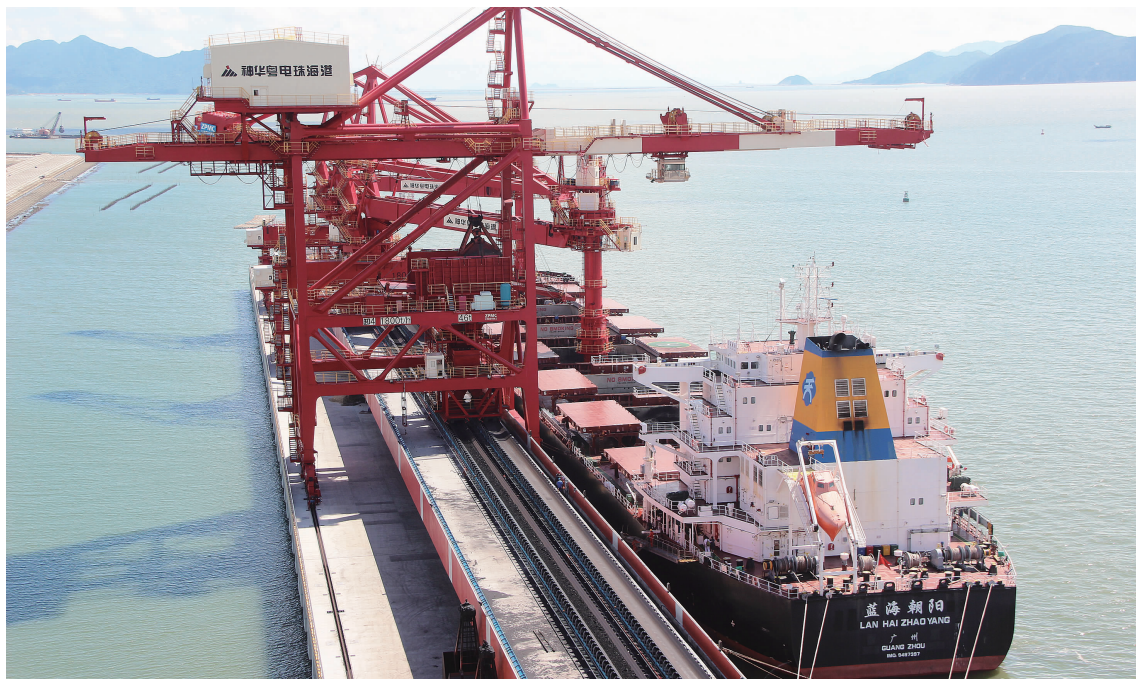
珠海高栏港神华煤炭储运中心一期工程,设计吞吐量4000万吨,2013年12月6日通过竣工验收。业主盛赞公司是一支“敢打硬仗、能打硬仗的队伍”。

从天津港、秦皇岛港、青岛港到珠海港、黄骅港;从国内的舟山港、唐山港到国外的马耳他港、毛里塔尼亚友谊港,中交一航局安装工程有限公司恪守“干一流的,做最好的”一航核心价值观,大力弘扬“拉得动,打得响”的优良传统,在海内外树起一座座金色丰碑。