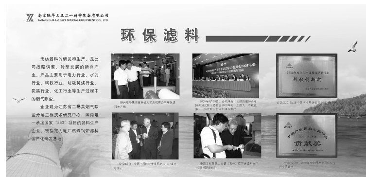
际华3521公司环保滤料展板

这家历经70余年改革发展,为中国军需后勤保障做出了突出贡献的国有企业,现在又投入到了形势严峻的环境保卫战中,而它要做的就是给烟囱戴上口罩,给锅炉戴上口罩,给大油机戴上口罩。无疑,际华3521已经成为给工业烟尘PM2.5微细粉尘戴上口罩的企业。