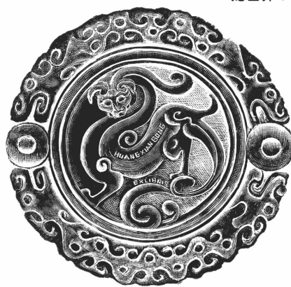
龙世界2 木口木刻 2011