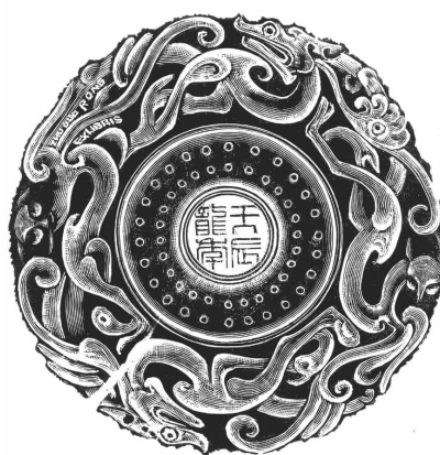
龙世界8 木口木刻 2012