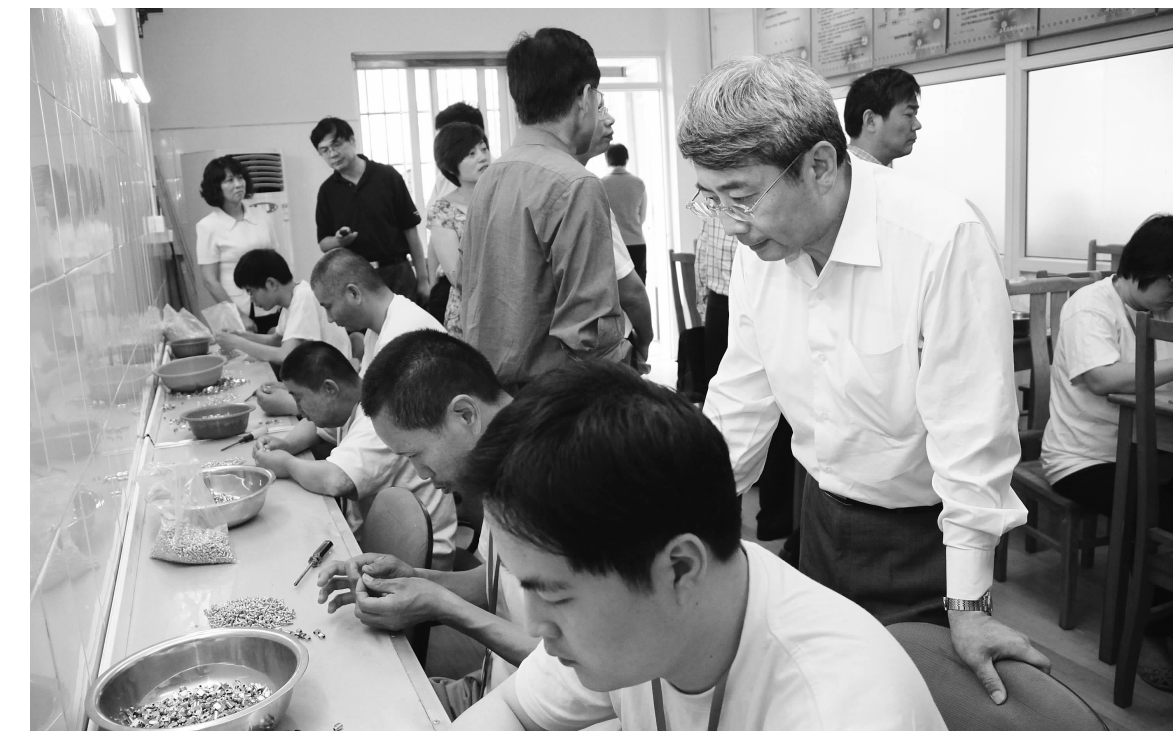
上海市残联党组书记金放视察残疾人工作场所

为促进福利企业和残疾职工集中就业的稳定发展,保障残疾人稳定就业,嘉定区民政局、区残联、区财政局、区人力资源和社会保障部门联合制定了《关于给予本区福利企业社会保险补贴的实施意见》,通过福利企业扶持新政策,稳定福利企业,提高残疾人集中就业的比例,并逐步提高残疾人的工资福利待遇。去年共发放资金376万元,83家福利企业获得政策补贴。目前,全区有11家福利企业实现残疾职工上岗率达100%或残疾职工工资