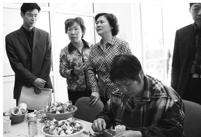
上海市残联理事长王爱芬视察嘉定就业工作