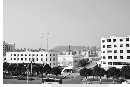
大学生创业园产业化基地