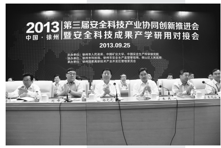
2013中国徐州第三届安全科技产业协同创新推进会召开