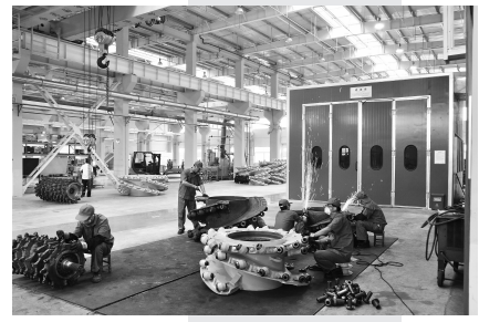
世界500强企业青纳金属落户徐州高新区