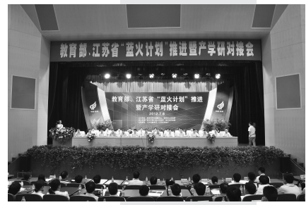
江苏省、教育部“蓝火计划”暨产学研对接会召开