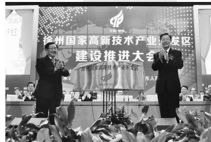
徐州国家高新技术产业开发区隆重揭牌

徐州国家高新技术产业开发区晋级为国家高新区后,将赢得更大发展空间,肩负更大发展责任。今后一个时期,徐州高新区将深入贯彻落实党的十八大及十八届三中全会精神,紧紧围绕打造“资源型城市转型发展示范区、科教资源推动创新引领区、矿山物联网特色产业先行区、东西部联动发展助推区”的总定位,围绕“跨越发展、争先进步”总目标,抓住产业发展第一要事,做强载体建设第一支撑,完善科技创新第一推动,凸显效能建设第一保证,全力突破资源要素制约,努力实现经济和社会事业又好又快发展。