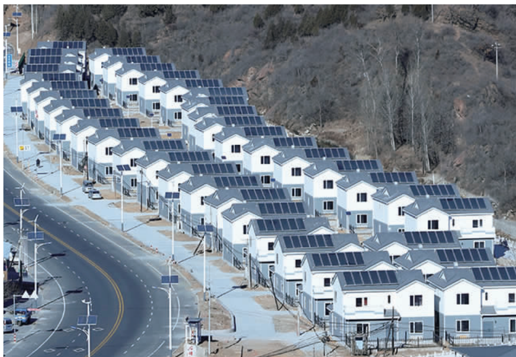
北新建材位于北京市密云县石城镇的新农村示范项目