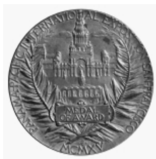
1915年巴拿马万国博览会大奖章

中国白酒最早生产工艺有三大特点:一是以“瓮”为发酵容器;二是以“清蒸二次清”为生产工艺;三是以固态发酵、固态蒸馏。在中国各种香型的白酒中,只有清香型酒符合上述三个本质特征。也就是说,清香型酒是最早的中国白酒。现在的浓香型白酒工艺和酱香型白酒工艺,都是用窖池发酵,用“续渣法”循环发酵。由此得出结论,清香型白酒是中国白酒的起源。而杏花村(仰韶时期)遗址出土的小口尖底瓮,充分证明了杏花村汾酒是中国白酒的起源。