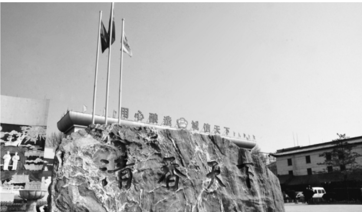
中国汾酒,清香天下

以汾酒集团的实践来看,文化营销具有“四两拨千斤”的作用。文化营销策划应用到位,可以“攻无不克,战无不胜”,创造出意想不到的市场奇迹。现今,汾酒集团的文化营销已是硕果累累,除大众传媒以及新兴媒体传播外,多种形式的品鉴会和文化鉴赏会让消费者进行的文化体验妙不可言。以终端店、专卖店、展会和工艺展、汾酒工业园等场合开拓的“可视化”文化建设成效显著,让消费者零距离亲近与解读汾酒文化已不是一句空话,“品汾酒即是品文化”已然成为一道亮丽的风景线。