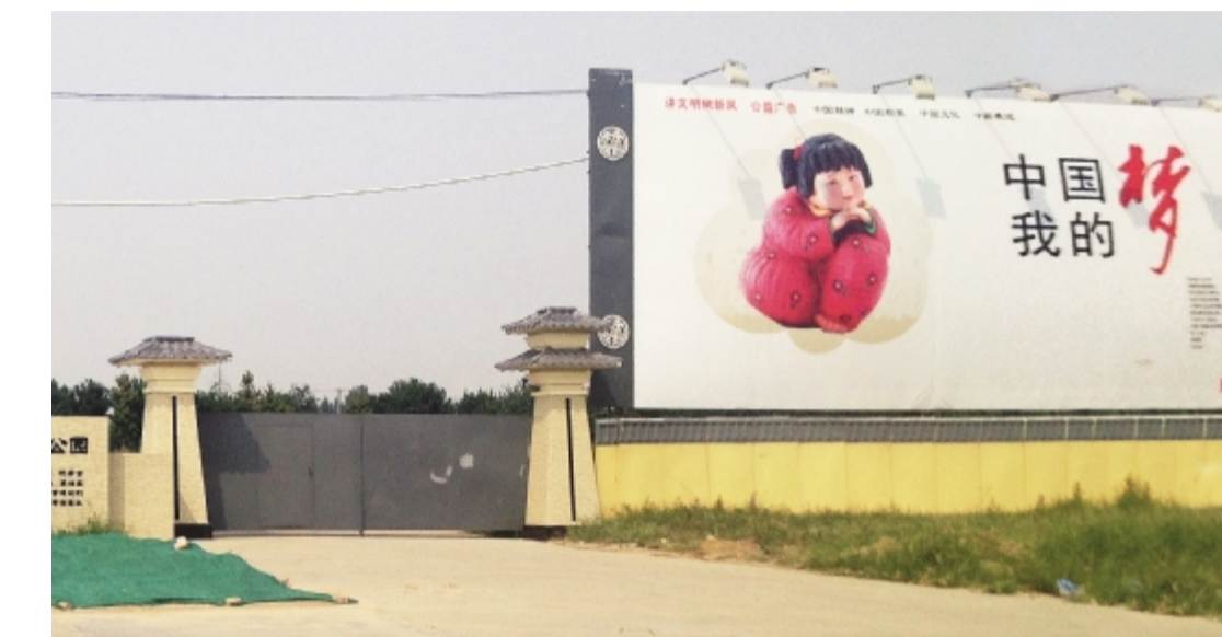
阿房宫遗址公园内杂草丛生,围墙上的公益广告牌格外醒目。

因缺乏配套设施,成了一个孤零零的仿古建筑,生意一直不好。阿房宫位于西安西郊,而西线客源本来就少,加之又是人造景点,旅行社不安排,当地人不去,只有少量散客。后来还曾做市场推广,打了很多广告,还是不见起色。