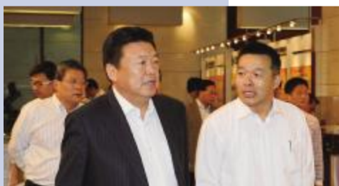
中国交通建设集团董事长刘起涛(前左)和专家与媒体一起观看科技创新成就展览