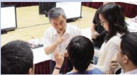
华能集团副总经理胡建民回答媒体记者的问题