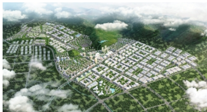
苍山区块城市设计鸟瞰图

2012年2月,浙江丽水被国土资源部正式批准列为全国首批低丘缓坡开发利用试点,在这一有利的政策大背景下,时年5月,丽水市委、市政府在辖区内缙云县壶镇镇成立浙江丽缙五金科技产业园区,仅半年多时间,园区就成为推动丽水实现“绿色崛起、科学跨越”的主引擎!