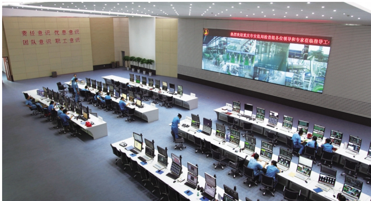
中国石化川维厂30万吨年醋酸乙烯项目全面建成投产

“中国石化集团川维厂长期以来致力于上游周边环境保护,始终坚持“环境友好,和谐共存”的企业文化理念,以清洁生产为抓手,加大环保治理,实现环境效益与经济效益的协调发展。