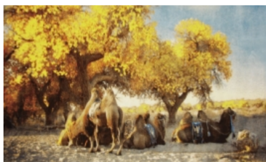
维斯克丝挂毯成为文化载体最好的诠释