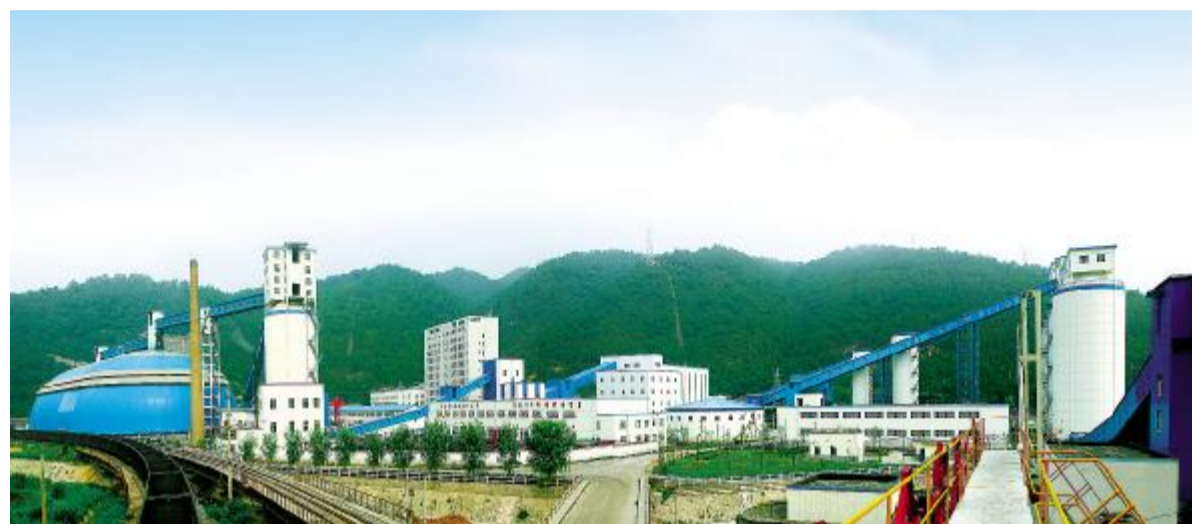
安全节能环保的现代化煤矿