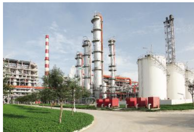
环境优美的花园式化工厂

源优势,大力发展煤矸石电厂和瓦斯发电,有选择地参与坑口发电,着力发展大型煤电一体化项目。