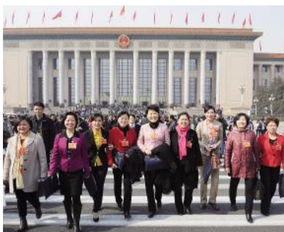
3月8日,是她们的节日。看,安徽代表团的女代表们笑得多么灿烂。