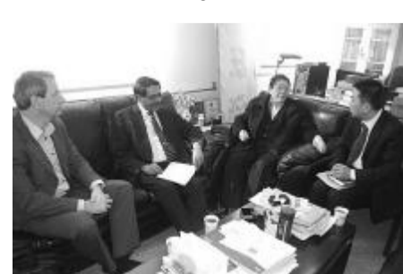
瑞典 ATLAS 集团访问研发中心