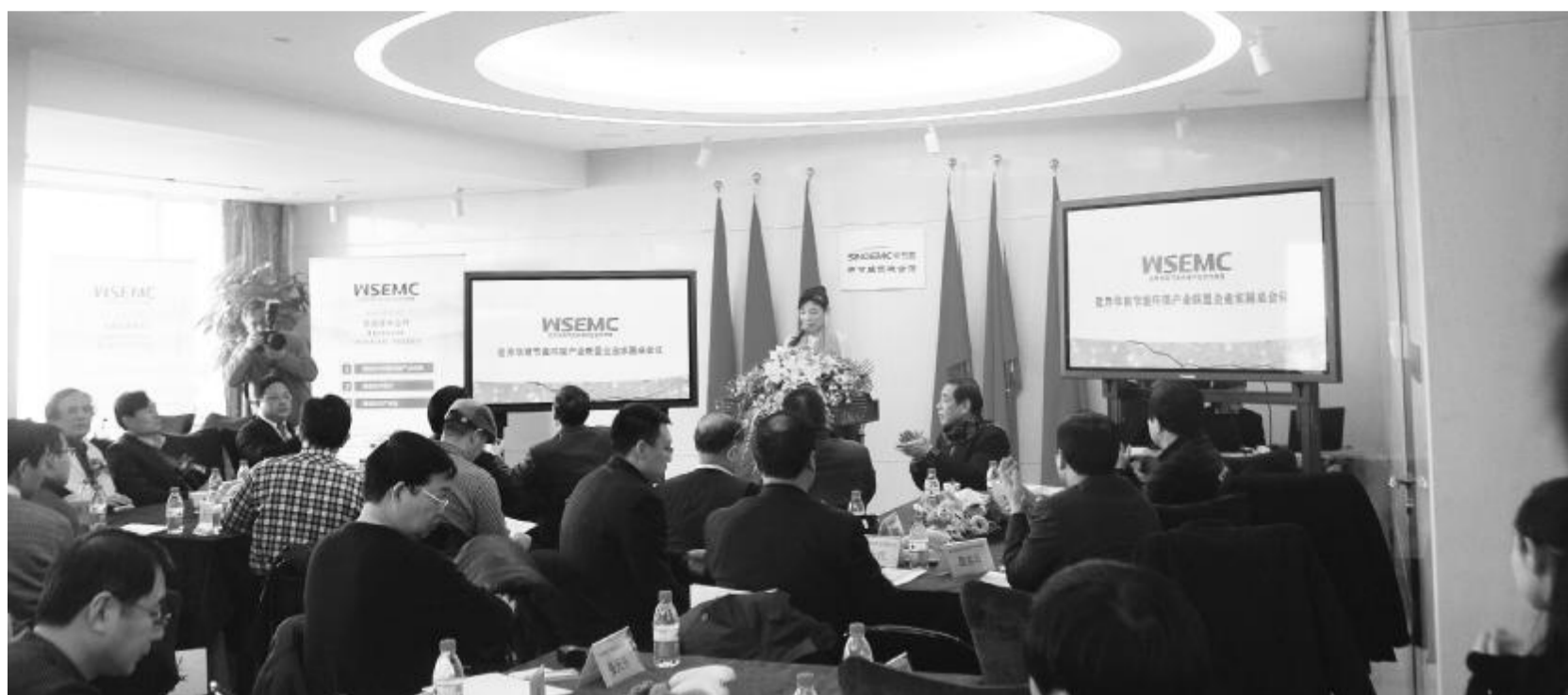
联盟为企业家举行圆桌会议