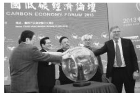
2011年1月底,节能汽车配套园正式启动。

2010年,中国·湖北(襄樊)节能产业园应邀参加了在北京钓鱼台国宾馆召开的“2010中国低碳经济论坛”。