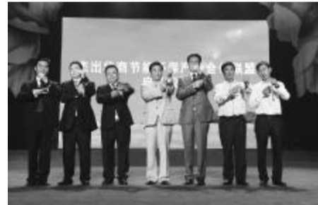
2013年1月7日,世界华商节能环保产业合作联盟企业家交流会于北京隆重举行,随后组团考察张家口。

2012年9月26日,第七届世界杰出华商大会华商500强论坛上,“世界华商节能环保产业合作联盟”成立。