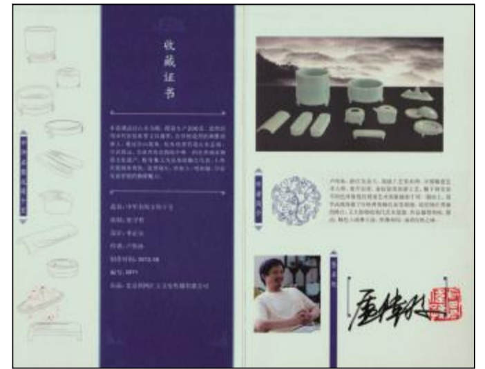
卢伟孙大师亲笔签名收藏证书

塑文房妙器承文脉千载,聚名窑圣手谱瓷韵新章。中国陶瓷,源远流长,博大精深。陶瓷美器,堪称是中式生活的一种象征。两家公司一直致力于推广高端中式生活方式,愿中华名窑文房十宝系列藏品能为您书斋添几许中国陶瓷的清韵雅致,为您的生活增一抹中华文化的瑰丽色彩。