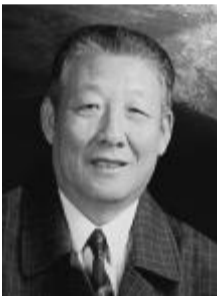
搞了一辈子航天,航天已经像我的“爱好”一样,这辈子都不会离开了。 ——孙家栋

事迹: 入党30年来,郭明义以无私奉献的实际行动,诠释了当代共产党人的坚定信念和高尚情操,赋予雷锋精神以新的时代内涵。他担任生产技术室采场公路管理员15年来,坚持每天提前两个小时上班,巡查、维护公路里程累计达6万多公里,公路达标率在98%以上,为企业创效3000多万元;他先后为“希望工程”、困难职工和灾区群众捐款12万多元,资助贫困学生180多名,自己却过着清贫的生活,被身边人誉为新时期的“雷锋传人”。