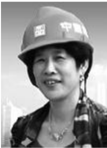
廉洁自律就是竞争力,风清气正就是生产力。 ——陈超英

事迹: 在中国自主研发发射的100多个航天器中,孙家栋担任负责人的就有30多个。如今,83岁的孙家栋,依然全身心地扑在各项纷繁复杂的系统工程中;依然在技术攻关或是卫星发射的关键时刻跟年轻人一起加班加点,甚至通宵达旦。为了中国的航天事业,孙家栋始终执著前行,从未停止过探索的脚步。