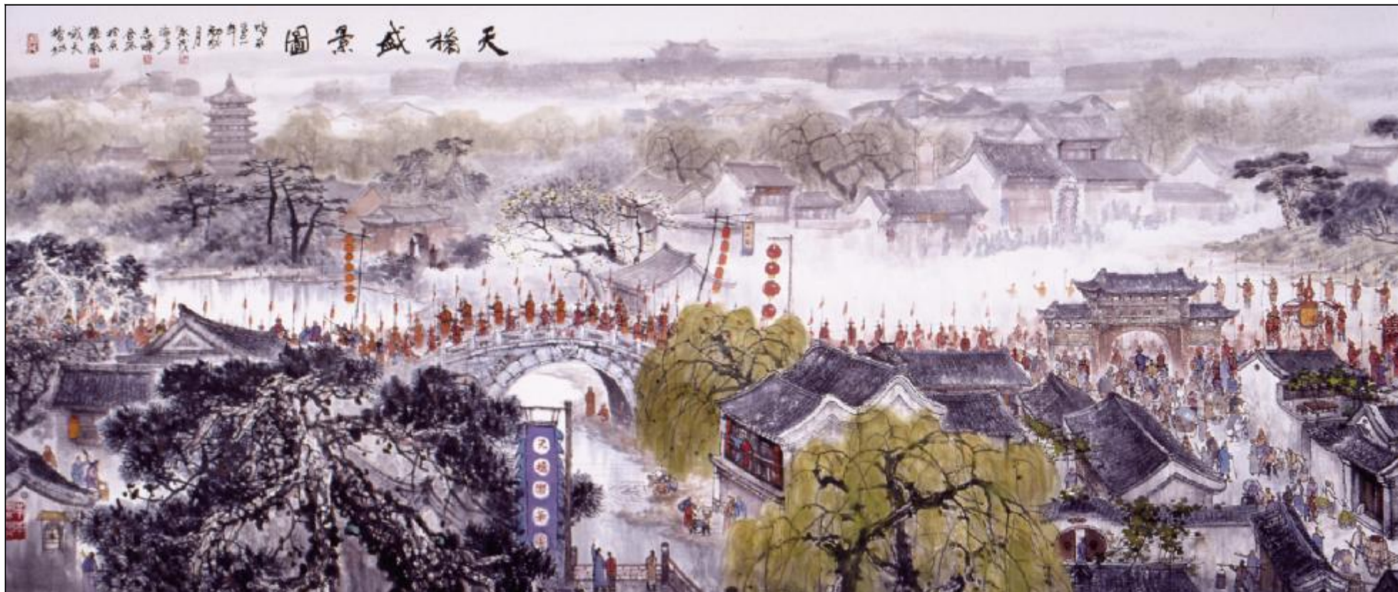
北京新北纬饭店收藏马海方巨作《天桥盛景图》,展示了当时天桥繁华时期的盛景,刻画了形象不同、形态各异的百余位人物,其作品场面生动、气势恢弘。