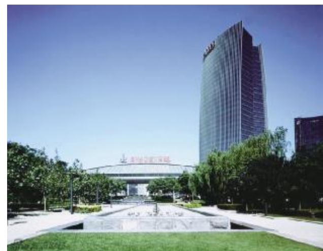
中国中钢 企业改革发展的根本推动力量和保障力量是人才,“人才强企”是集团发展的基本方略