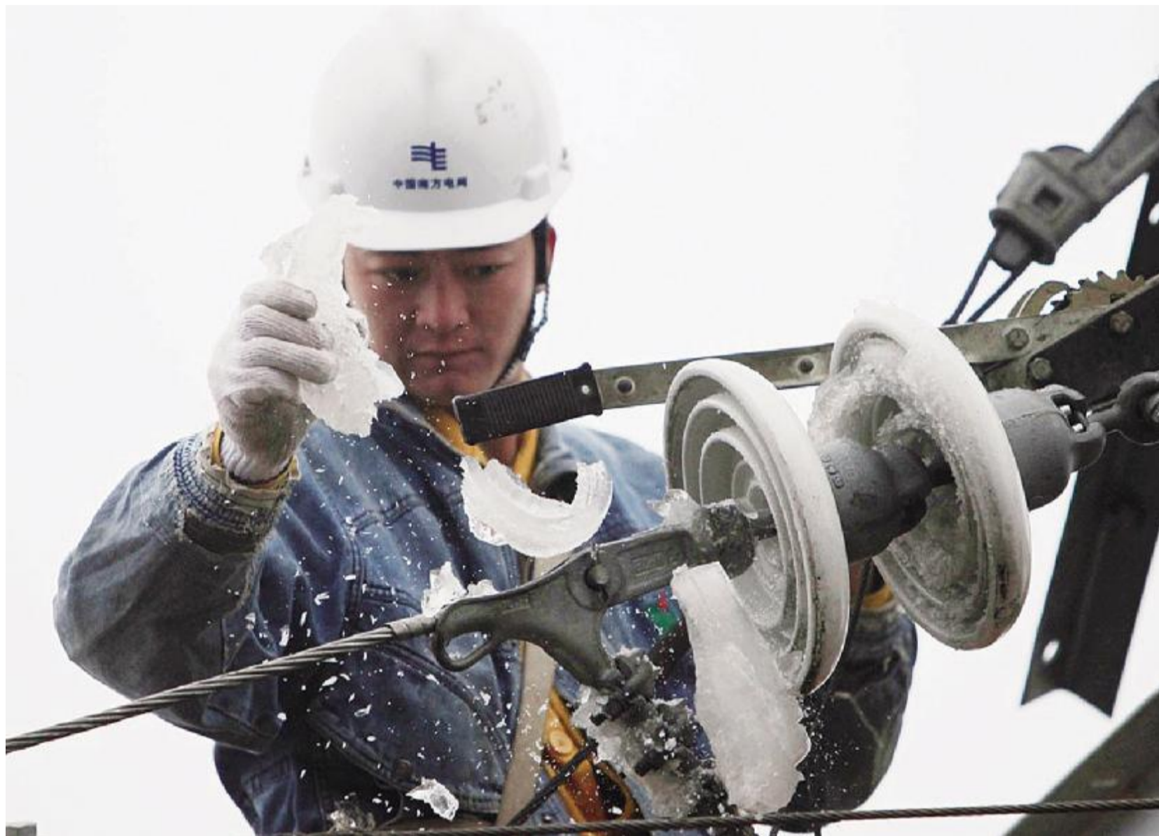
南方电网 公司成立7年来,主动承担社会责任,全力做好电力供应,加快电网发展、强化经营管理、深化体制改革、培育优秀文化,一步一个脚印、一年一个台阶,走上了科学发展的轨道

实施人才强企战略,就是要积极开发利用国内国际两种人才资源,大力推进人才职业化、市场化、专业化、国际化,大幅提高人才创新能力;坚持高端引领、整体开发,统筹推进出资人代表、经营管理人才、党群工作者、科技人才和技能人才队伍协调发展,结构不断优化,素质明显提高。中央企业今年有12人增选为中国工程院院士,60人新列入中央“千人计划”,13家企业成为新一批人才基地建设单位,以北京未来科技城为重点的人才基地建设顺利推进,“责任央企”形象进一步树立。