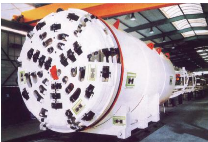
中国铁路工程总公司 公司现有员工29.23万人,各类专业技术人员100599人,其中多人获国家及省部级突出贡献奖,高级人才辈出