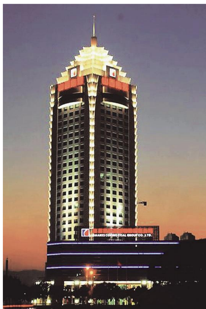
中国煤炭科工集团 公司人力资源部日前组织了在京企业2012年度应届毕业生招聘第一次笔试