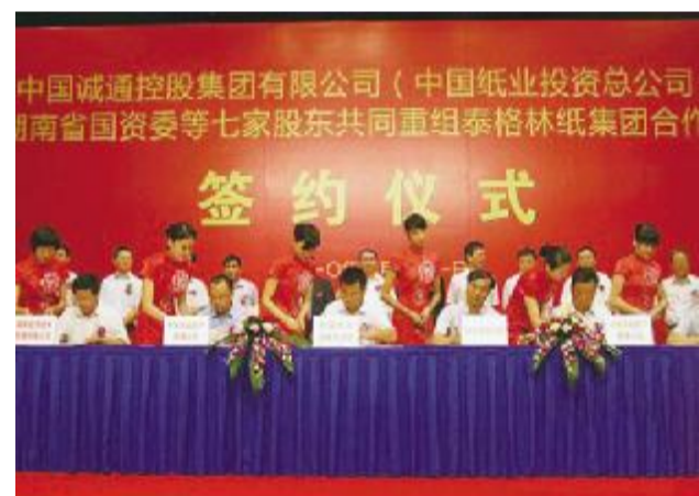
中国诚通控股集团 以能力建设为中心,建立一支熟悉国内外资产经营和产业经营、有丰富资产经营工作经验、产业运营经验和强大行业研究能力的团队