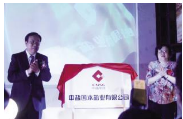
中国盐业总公司 近日,中盐公司对在岗的中层管理人员进行年度考核。从德、能、勤、绩、廉五个方面综合测评,重点考核工作业绩