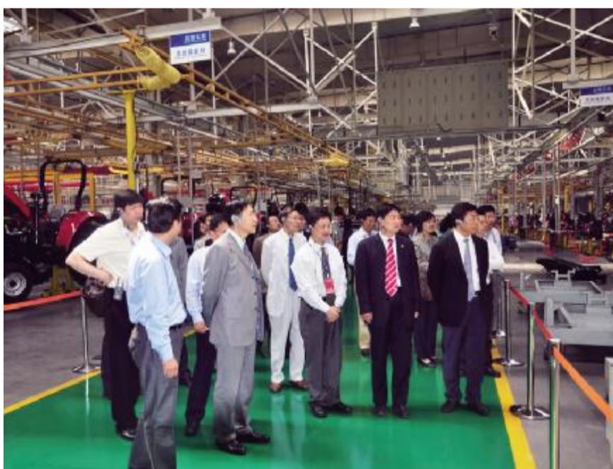
中国机械工业集团 公司拥有50家全资及控股子公司,6家上市公司,70多家海外服务机构,全球员工总数近8万人。国机集团连续多年保持30%以上的高速增长,2008年经营额已突破1000亿元