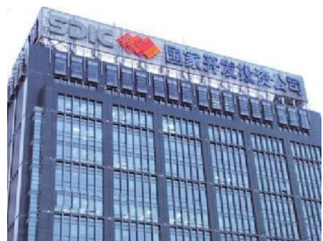
国家开发投资公司 国投注册资本194.7亿元,资产总额2373亿元,2010年实现经营收入646亿元人民币,利润68亿元人民币,员工总数7万多人