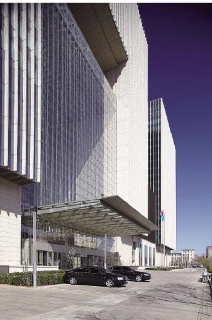
中石油 公司近日启动投资欧洲炼油、贸易业务的程序,意味着其对欧洲石油市场的进攻号角已经吹响