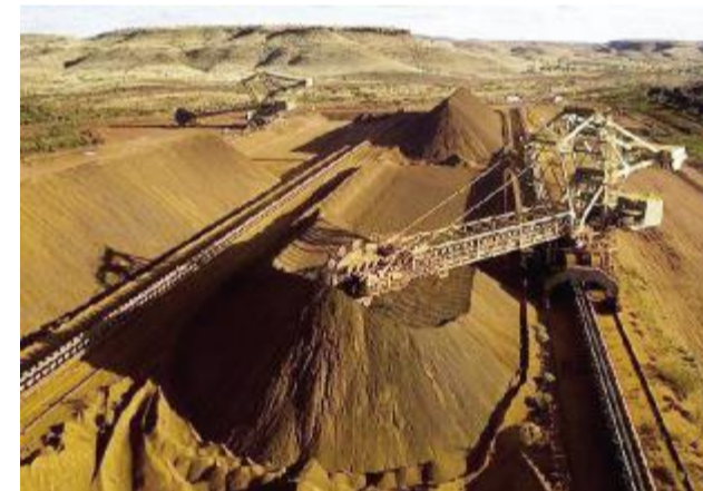
中国有色 公司目前确定了由中央企业向具有国际竞争力的大公司跨越的目标