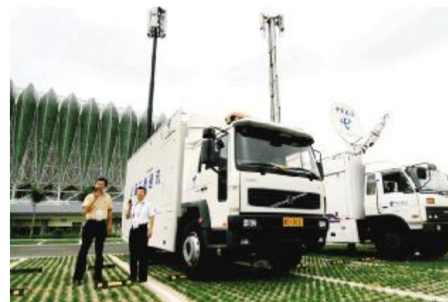
中国电信 近年来,中国电信通过服务“走出去”的中资企业和境外跨国企业,业已形成完善的国际化布局,在世界的通信领域占领一席之地