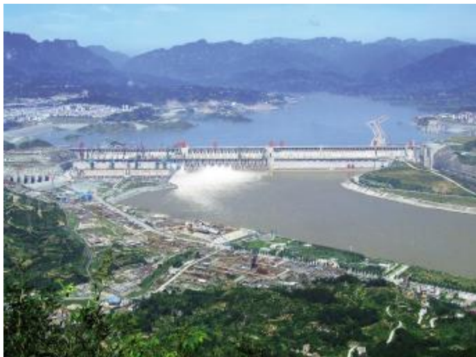
三峡集团 三峡集团的国际化战略目标是成为跨国经营并具有国际竞争力的清洁能源公司