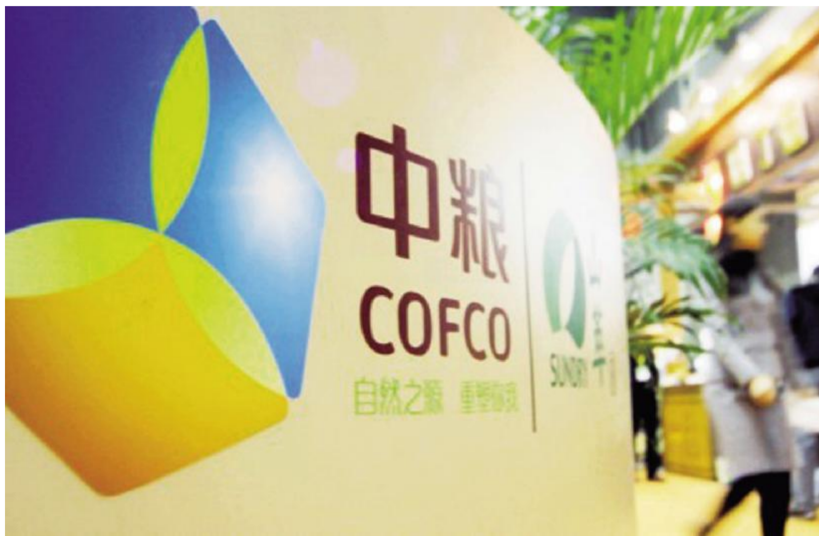
中粮集团 中粮最终就是要做成以中国市场为基础、以全球供应链来供应的公司