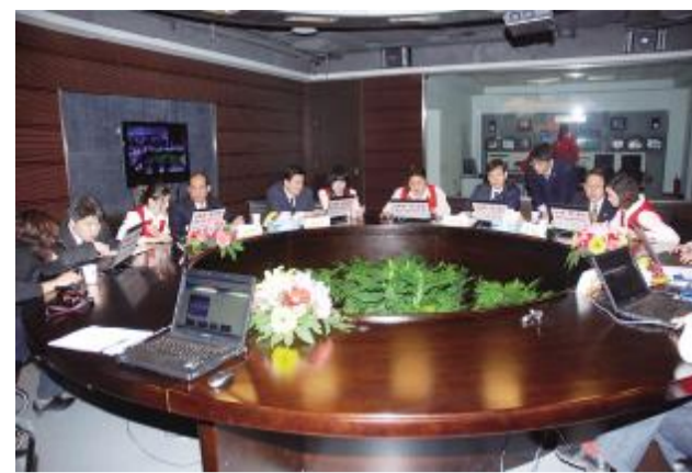
北京矿冶研究总院 公司在有色金属采矿、选矿、冶炼等领域代表国家水平进入国际竞争

国务院国资委自今年开始实施中央企业“走出去”战略,明确了“十二五”期间央企“走出去”工作的主要任务。其中,加快“走出去”步伐,着力提升国际化经营水平;培养全球化战略思维和国际化视野,着力增强全球资源配置能力;加强学习与创新,着力打造具有国际竞争力的跨国企业集团成为最重要的战略之一。初步统计,1—11月中央企业在境外(含港澳地区)营业收入 3.4 万亿元,实现利润总额 1280 亿元,同比分别增长 30.7%和 28%;中央企业海外原油权益产量 6604.3 万吨,天然气权益产量 176.3 亿立方米,海外工程新签合同额 2797.5 亿元,同比分别增长 16.9%、19.8%和 9.7%。央企融入世界产业链的步伐明显加快。