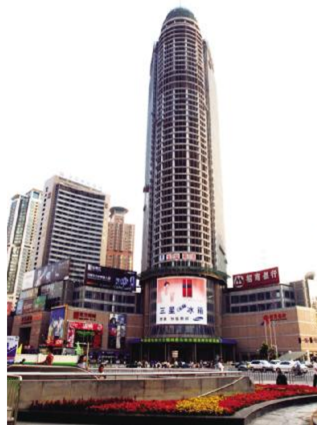
招商局集团 作为内地和香港的重要投资者和经营者,招商局已基本形成全国性的集装箱枢纽港口战略布局,旗下港口分布于香港、深圳、上海等并迈开了国际化战略步伐