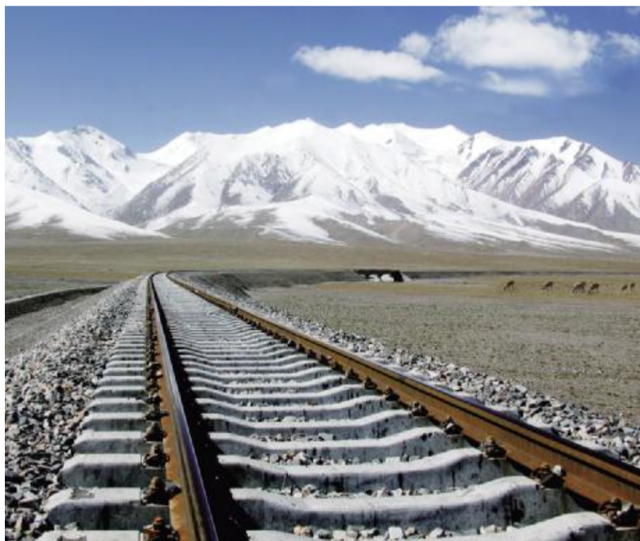
中铁建 依托海外市场品牌效应,中铁建已着手在海外经营与建筑相关的多元化业务