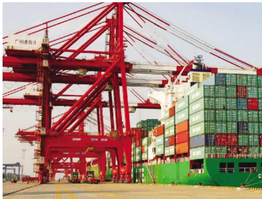
中煤能源 公司以实现战略转型、境内外两地上市、建成亿吨级煤炭大集团为标志,已步入中央企业第一方阵和世界煤炭公司前列