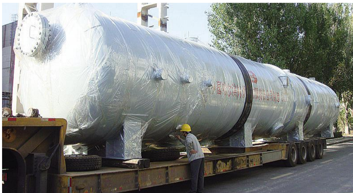
哈电集团 从产品设计开始就注重节能降耗