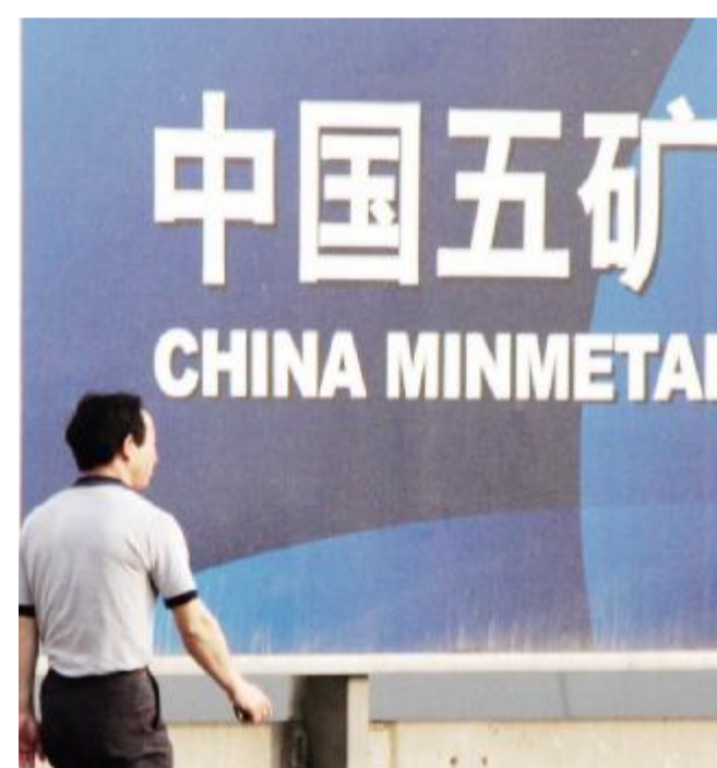
中国五矿 为加大节能减排,公司启动了一批节能减排技术改造项目,环保成效非常显著