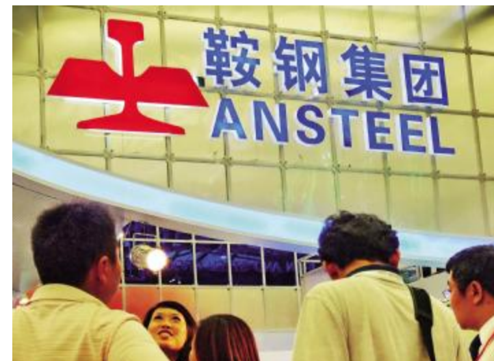
鞍钢集团 处理率和利用率分别达到100%和70%,保持了世界领先水平