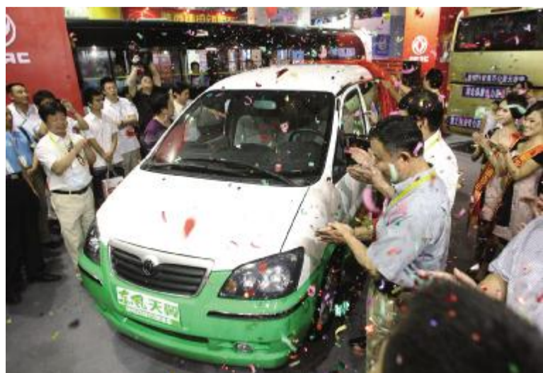
东风汽车 首创移动能源车助推节能减排