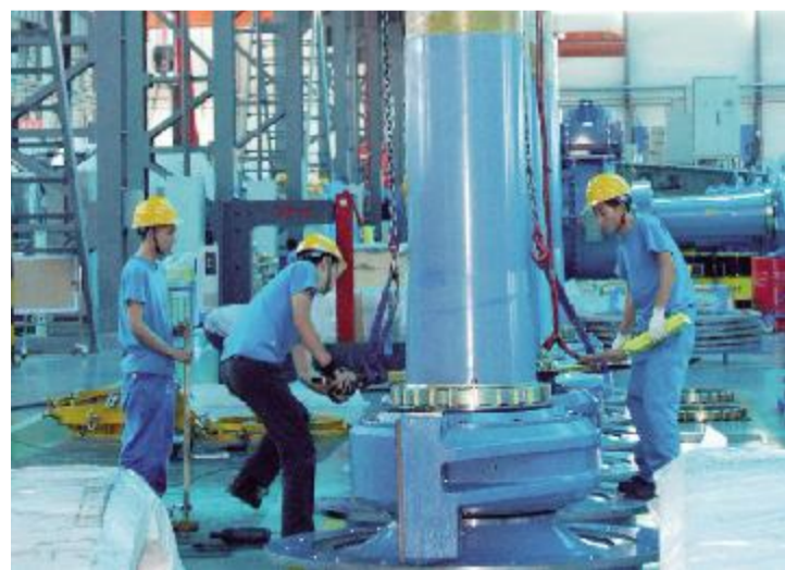
东方电气集团 不断提供绿色产品,进一步加强自身节能减排体系建设