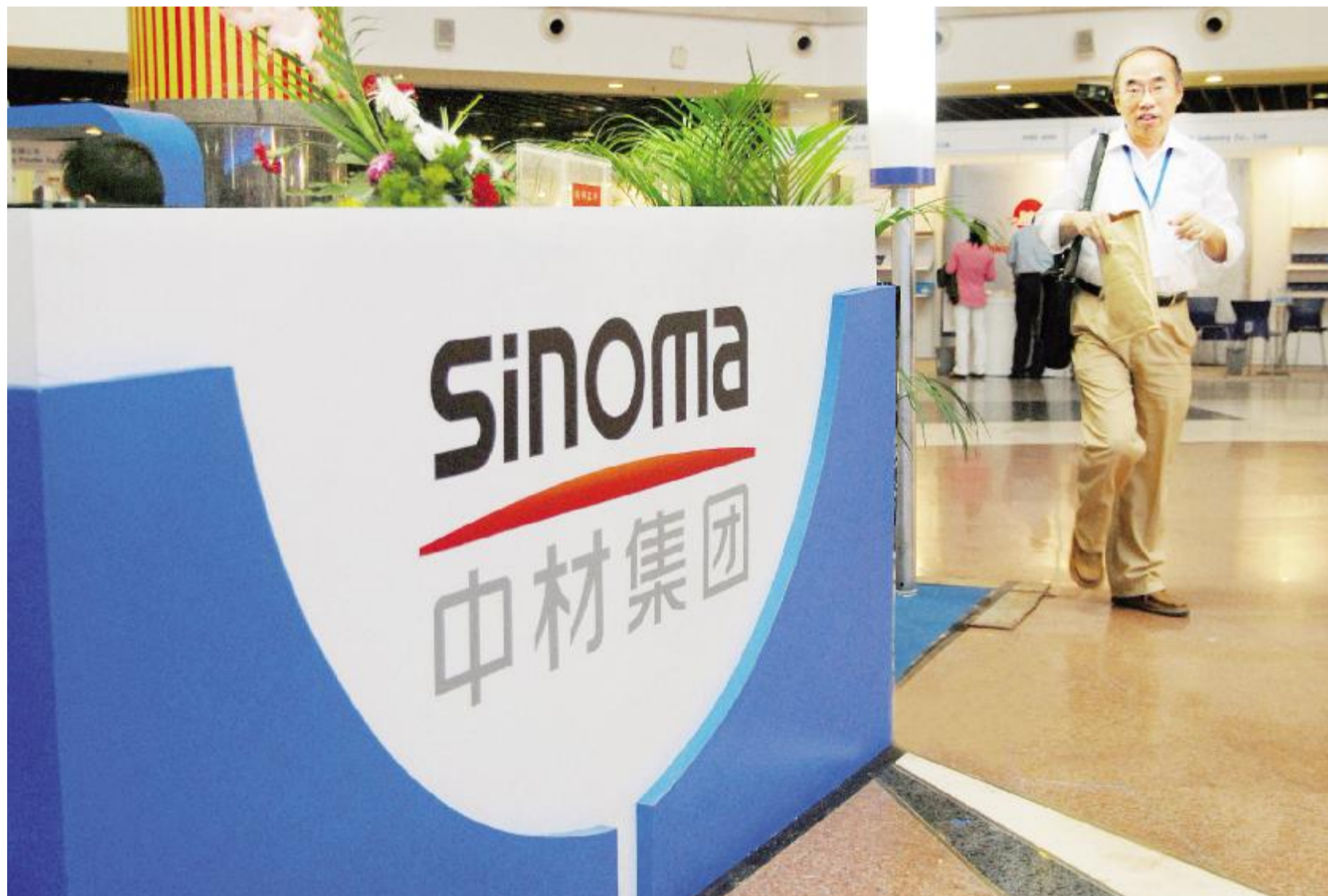
中材集团 充分利用纯低温余热发电技术,在全部水泥生产线上配套建设余热发电系统