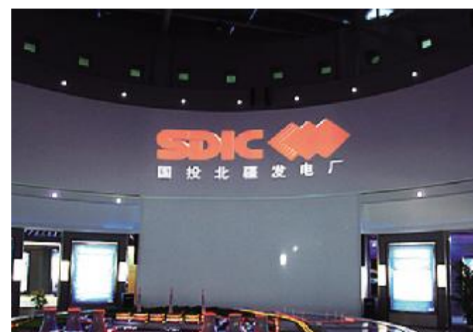
国投公司 国投北疆发电厂将发电项目和海水淡化有机结合,最大化提高资源利用效率,为京津冀淡水供应提供了战略保障

实现绿色和谐发展,是央企不懈努力的方向和目标。为进一步推动节能减排工作,央企认真贯彻落实科学发展观,不断增强社会责任意识,将节能减排、保护环境,创建低碳经营格局,实现社会可持续发展作为责无旁贷的责任。中材集团、东方电气、鞍钢集团、宝钢集团、东风汽车集团等一大批央企率先垂范,建立节能减排保障机制,优化产业及能源结构、大力推进循环经济,全社会节能减排的带动作用显著增强。“十一五”时期,央企节能减排成效显著,到2010年底,中央企业万元产值综合能耗(按可比价计算)比2005年下降20.3%;五年累计节能1.75亿吨标准煤,占全国节能量的27.8%。