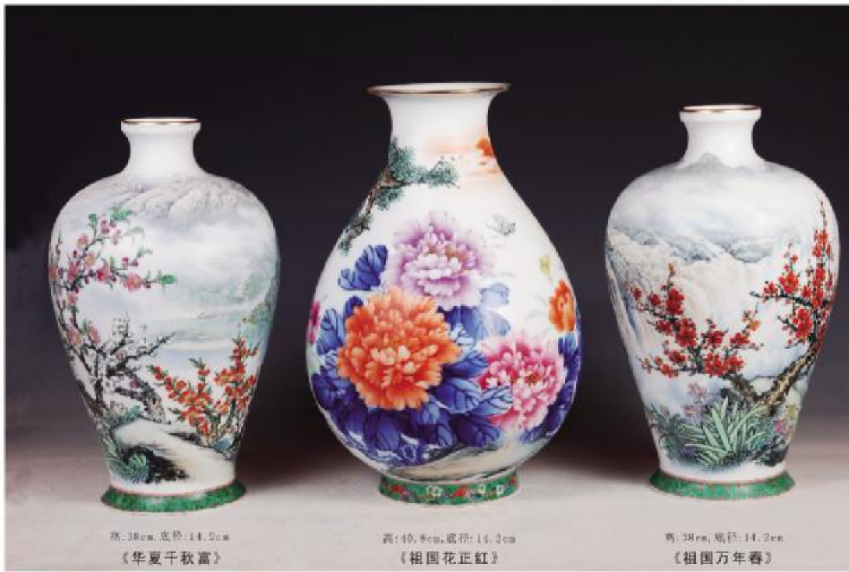
高:38cm,底径:14.2cm 《华夏千秋富》