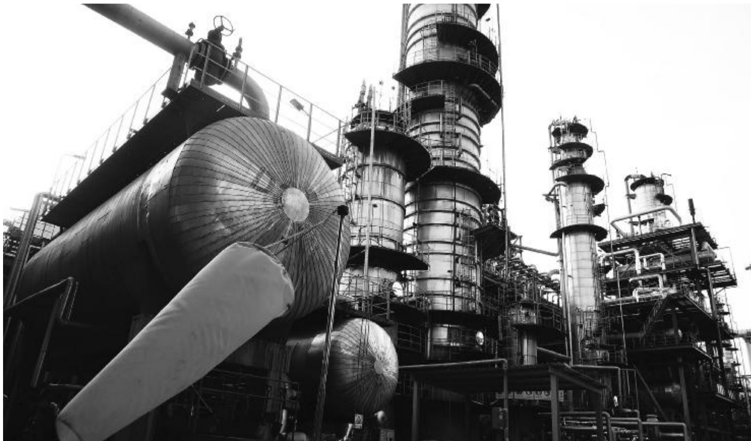
从挣扎于生死边缘到如今的风光无限,入世十年,央企实现了完美而华丽的转身