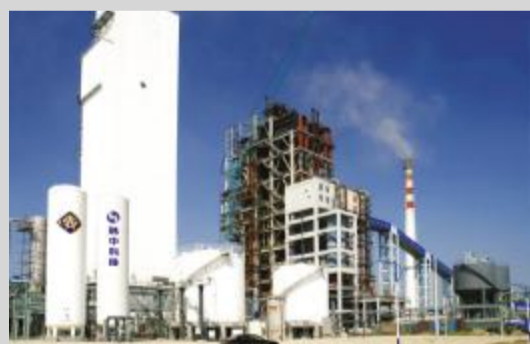
煤化工产业园 50 万吨甲醇项目