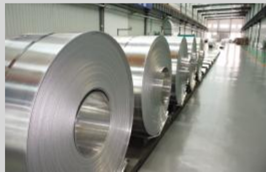
铝精深加工产业园河南科源电子铝箔有限公司电子铝箔车间

该企业位于装备制造产业园,隶属于世界 500 强企业——河南煤业化工集团,属于装备制造龙头企业,2010 年实现销售收入 81.37 亿元,其投资兴建的仓储物流及保温材料项目集矿用产品产供销于一体,带动更多装备制造企业入驻,形成纵向关联、横向配套的装备制造产业集群。