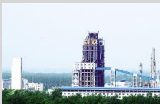
煤化工产业园一角