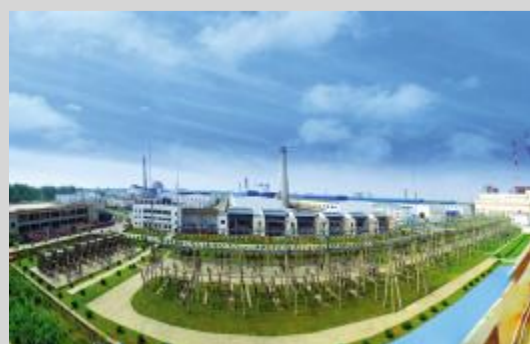
铝精深加工产业园一角