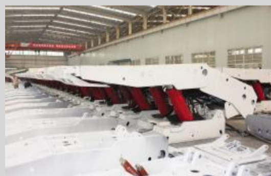
装备制造产业园机电修厂生产车间