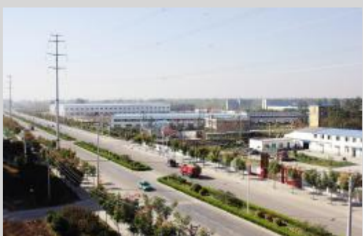
装备制造产业园一角