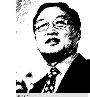
柳传志 有理想但不是理想化

也敢于严格要求自己站在全球化的角度说:我们要以中国心和专业能力加本土功夫做事,做好事。”