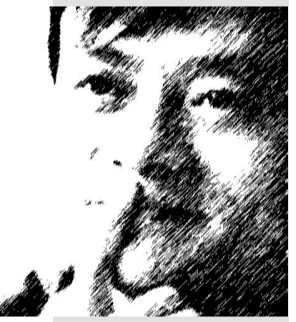
马云 人家倒下去 我还站在那